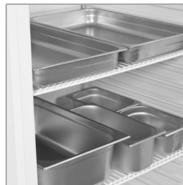
Diseñado para bandejas GN1/1 (no incluidas)