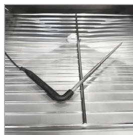
Sonda de núcleo incluida