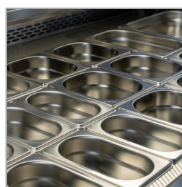
Diseñado para bandejas GN1/1 (no incluidas)