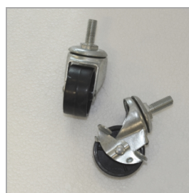
Ruedas giratorias resistentes