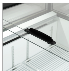
Tapas de cristal deslizantes