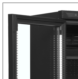
Luz LED en interior de marco de puerta