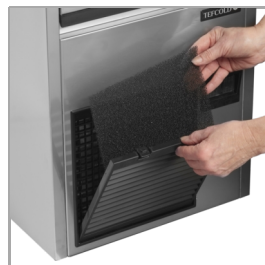
Filtro de condensación de fácil limpieza