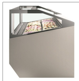
Paredes de cristal como estándar