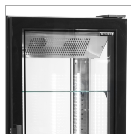
Puerta sin marco