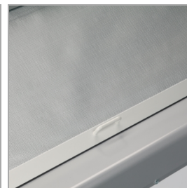
Cortina nocturna trasera para mantener la temperatura