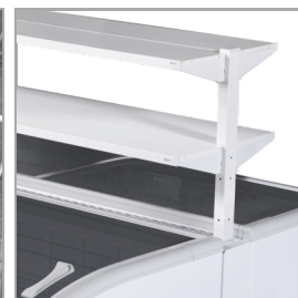
Estantes promocionales como accesorio