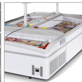
Instalación en isla, estantes como accesorio