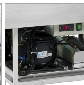
Evaporación automática de agua de descongelación