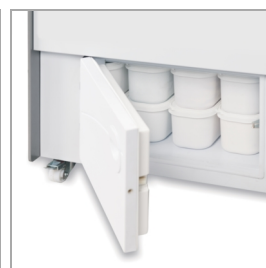
Compartimento de almacenamiento de fácil acceso