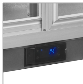
Cubierta térmica protectora