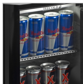
Diseñado para latas de bebidas energéticas