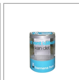
Apto para gráficos