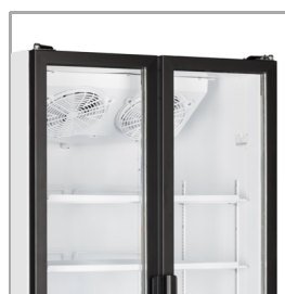
Puertas de altura completa