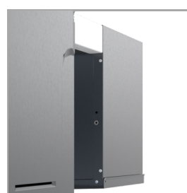
Monobloque trasero, sin panel anexo